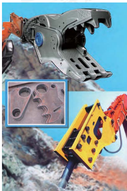
破碎锤、液压剪应用